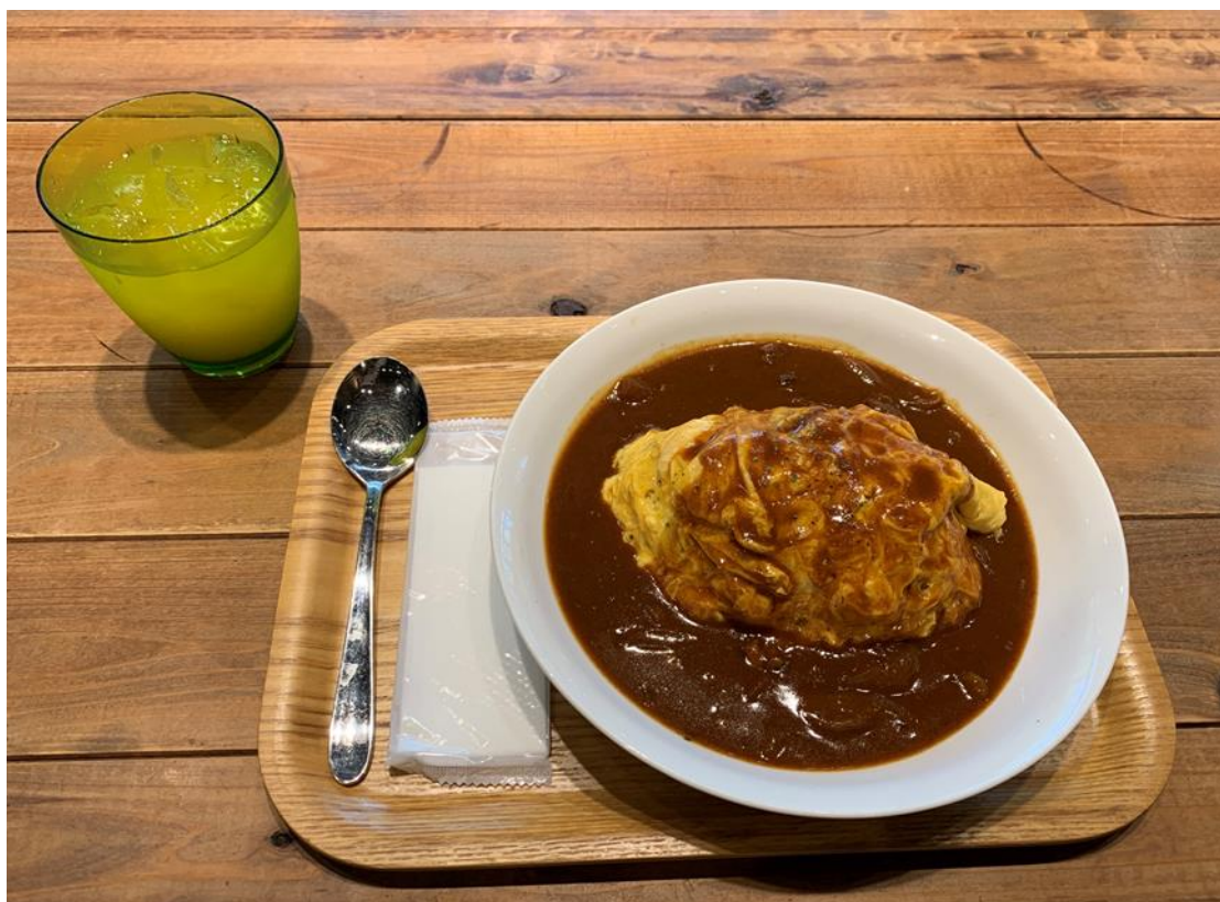
学校の食堂でのカレーオムライスです。