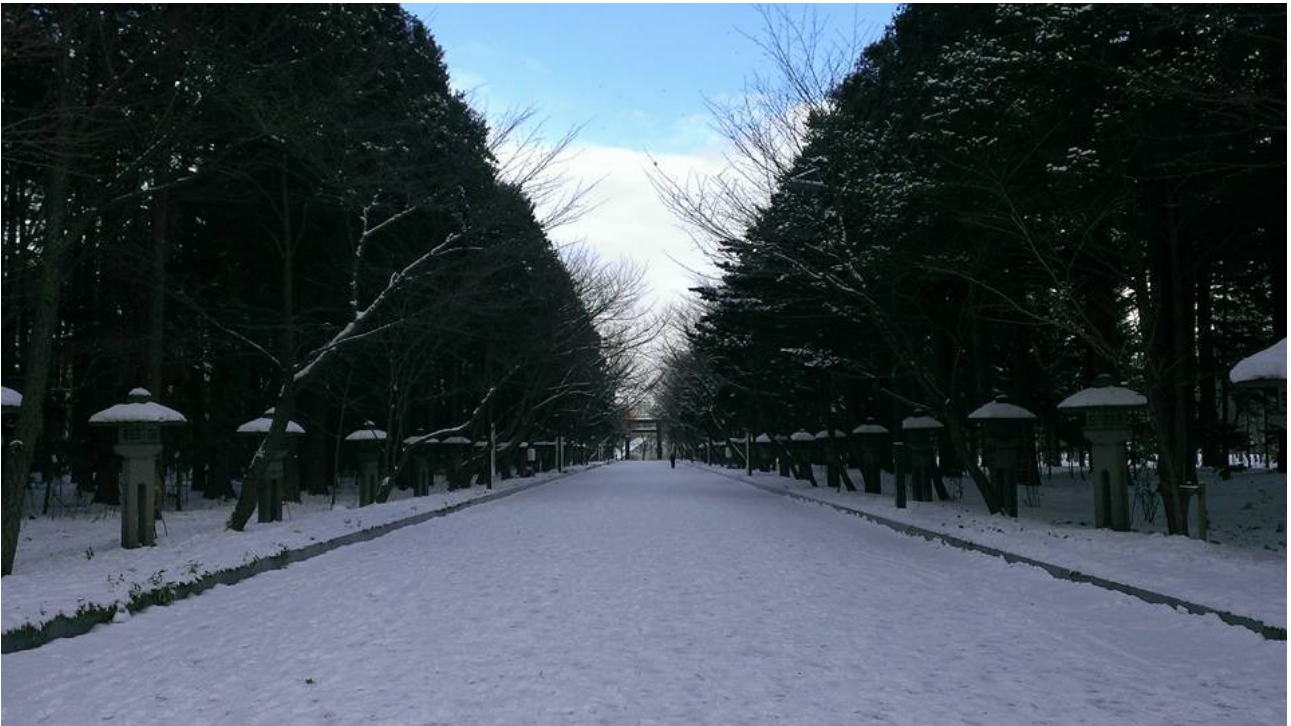
(北海道－札幌－北海道神宮)