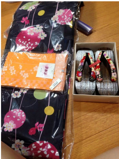
←在日本買的美美浴衣

七月也是日本的祭典月份，在我們住的宿舍附近剛好有辦一個叫做「葛飾納涼花火大會」的活動，那天是禮拜二，原本計畫和學姐一下課就衝回去換浴衣的，只是老師臨時說有茶道體驗且一定要參加，所以行程被延誤到，衝回宿舍換好衣服再衝去搭公車也來不及，最後是在公車上看完煙火的(各種杯具)，雖然還是有去逛且買了炸薯條、彈珠汽水等小吃，最後也是慢慢的邊散步邊走回去。