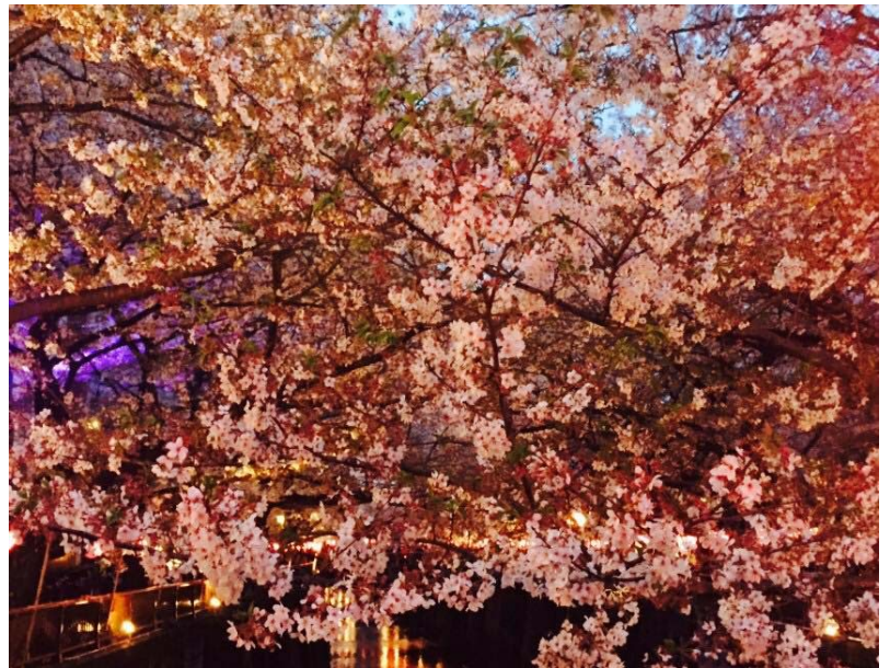
(左)後樂園 (右)目黑川夜櫻

四月就是日本的賞櫻季節, 隔天下午我與台灣同學一起去參加台日交流的賞櫻會, 在代代木公園, 來日本認識到一群非常喜歡參加台日交流會的同學們, 藉由很多活動認識到喜歡台灣的日本人, 非常有趣! 一起帶零食和飲料一邊賞花一邊玩遊戲~四月真的就是每天不斷在賞花哈哈