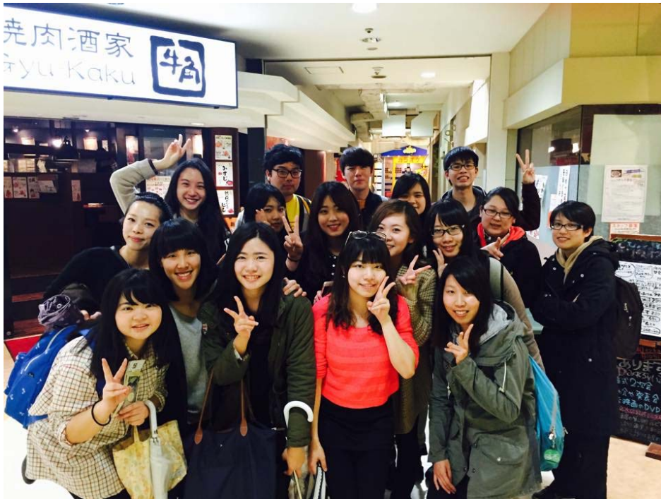
→與班上同學吃燒肉~~

開學第三個禮拜班上辦了飲み会, 歡迎我們新來的六位留學生加入, 還有順便幫班上三位同學慶生! 我們又去吃燒肉啦~~ 食べ放題吃到快撐死還是要拼命吃! 限時九十分鐘吃, 大家嘴巴沒停過啊!