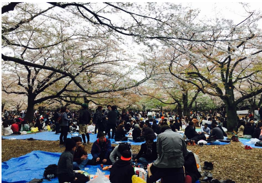
→在代代木公園 賞花

四月就是日本的賞櫻季節, 隔天下午我與台灣同學一起去參加台日交流的賞櫻會, 在代代木公園, 來日本認識到一群非常喜歡參加台日交流會的同學們, 藉由很多活動認識到喜歡台灣的日本人, 非常有趣! 一起帶零食和飲料一邊賞花一邊玩遊戲~四月真的就是每天不斷在賞花哈哈