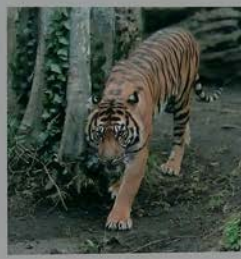
スマトラトラ Sumatran Tiger 蘇門答臘虎 蘇門答臘虎 수마트라호랑이