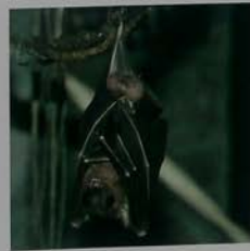
デマレールセットオオコウモリ Leschenault's Roussette 棕果蝠 棕果蝠 황갈색과일박쥐