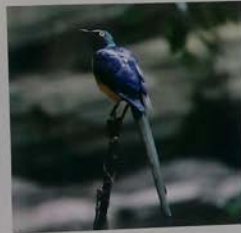
キンムネオナガテリムク Golden-breasted Starling 金胸椋鳥 金胸椋鳥 황금가슴찌르레기