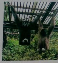
シロテテナガサル White-handed Gibbon 白掌長臂猿 白掌長臂猿 흰손긴팔원숭이