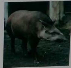
アメリカバク South American Tapir 南美貘 南美貘 남아메리카테이퍼