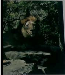
インドライオン Asiatic Lion 亞洲獅 亞細亞獅 인도사자