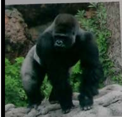
ニシゴリラ Western Lowland Gorilla 西非低地大猩猩 西部低地大猩猩 서부로랜드고릴라