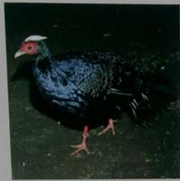
コサンケイ Edward's Pheasant 愛氏雉 愛氏鸚 쇠산계