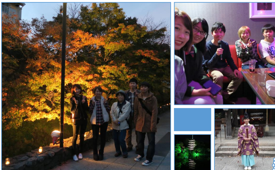
跟指導老師還有チューター們去長府參加祭り and 瑠璃光寺，以及跟チューター們一起唱歌。