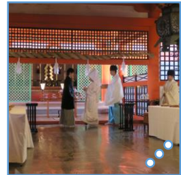
○ 海上大鳥居 ○○ 鹿 ○○○ 日本伝統の結婚式 ○○○ サルの雑技 ○○○ 紅葉