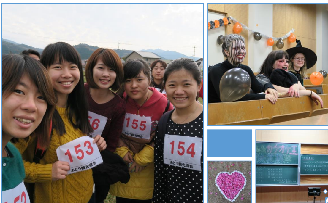
學校的ハロウィンパーティ、姫山祭、徳佐的収穫祭