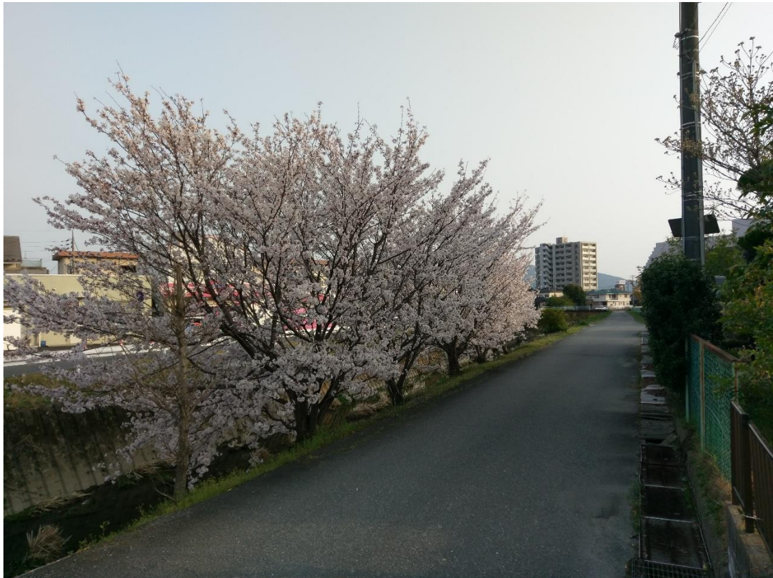
(シェアハウス近くの桜)

日本の四月と言えば、やはり日本各地の桜がどんどん咲き、百花繚乱の春になることしか思わない。日本全国の桜の数は、台湾よりも何倍があると思う。その理由は、寮の周辺は道の両側とか川の両側とか大量の満開の桜がある。それに、たとえ周辺の山でも、普通に見えると幾つの野良桜が見つかる。